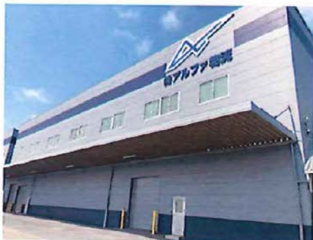
倉庫A棟 鉄骨造2階建