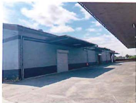
倉庫C棟 鉄骨造平家建