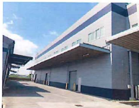
倉庫B棟 鉄骨造2階建